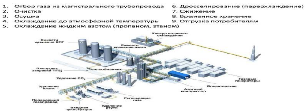
Рис. 2 – Принципиальная функциональная структура завода-криогенератора по ожижению шахтного метана

Основными ограничениями при выборе криогенного цикла и технологии сжижения являются следующие составляющие: производительность, качественные характеристики исходного сырья, температура сжижения, давление, качество конечного продукта.